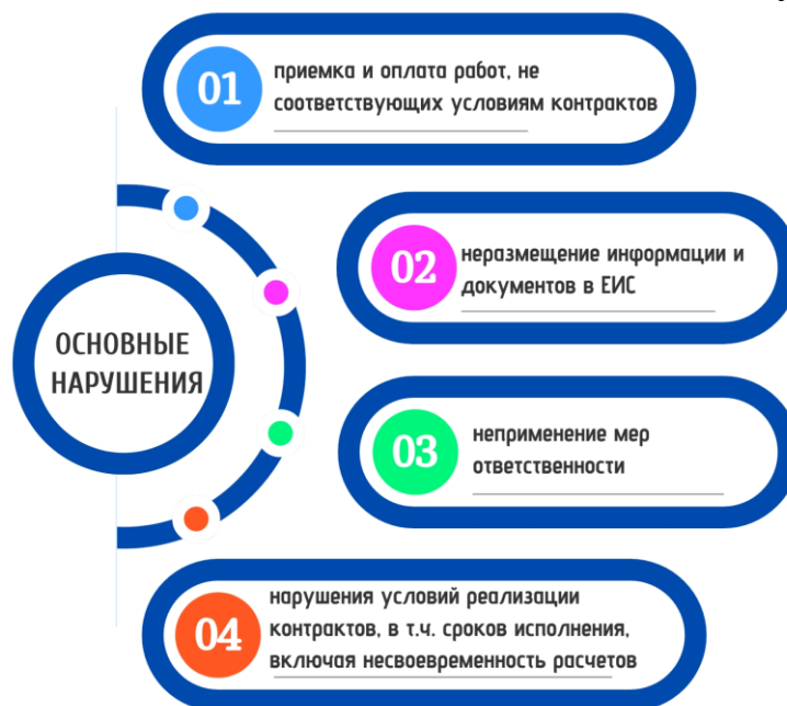
Рис. 9. Типовые нарушения законодательства о контрактной системе, выявленные Счетной палатой в 2024 году

Наиболее системными нарушениями законодательства о контрактной системе в сфере закупок (более 75% от общего количества нарушений в сфере закупок), выявленными Счетной палатой за 2024 год, являются нижеследующие.