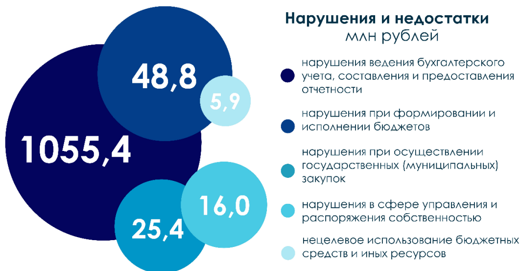
Рис. 2. Структура выявленных Счетной палатой в 2024 году нарушений и недостатков в суммовом выражении, млн руб.

Кроме этого, рассмотрено 109 вопросов о ходе реализации и снятии с контроля ранее принятых решений Коллегии Счетной палаты.