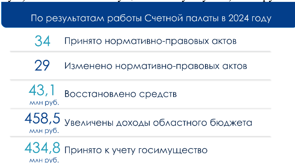
Рис. 4. Отдельные результаты деятельности Счетной палаты в 2024 году

Выполняя требования представлений Счетной палаты, внесенных по результатам контрольных мероприятий 2024 года и предыдущих периодов, объекты контроля восстановили средства в бюджетную систему области в сумме 43,1 млн руб. Реализация предложений Счетной палаты привела к увеличению доходов регионального бюджета на 458,5 млн руб. Принято к учету в государственную (муниципальную) собственность имущество на сумму 434,8 млн руб.