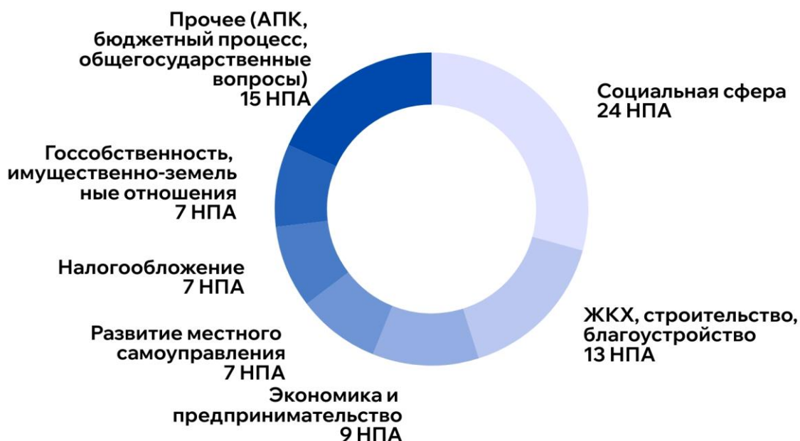
Рис.8. Сферы правового регулирования законопроектов и иных НПА, по которым Счетной палатой были подготовлены заключения в 2024 году, ед.

В 2024 году на системной основе проводилась экспертиза проектов законов Владимирской области и иных нормативных правовых актов исполнительных органов Владимирской области в части, касающейся расходных обязательств Владимирской области, экспертиза проектов законов Владимирской области и иных нормативных правовых актов исполнительных органов Владимирской области, приводящих к изменению доходов областного бюджета, по результатам которой подготовлено 82 заключения ( приложение № 4 к настоящему отчету).