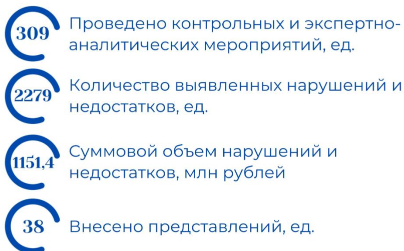
Рис. 1. Основные результаты деятельности Счетной палаты в 2024 году

Счетная палата осуществляла внешний государственный финансовый контроль в соответствии с планом работы на 2024 год (с изменениями, вносимыми в течение года), сформированным с учетом поручений Законодательного Собрания Владимирской области (1 мероприятие), предложений Губернатора Владимирской области (5 мероприятий) и Счетной палаты РФ (2 мероприятия) с применением риск-ориентированного подхода при организации и осуществлении внешнего государственного финансового контроля. Мероприятия, предусмотренные планом, выполнены.