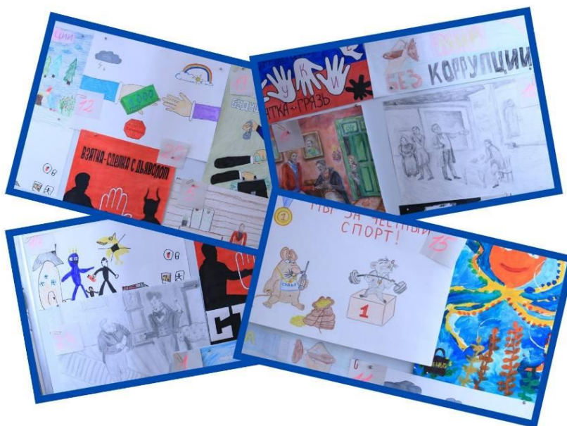
Рис. 11. Работы, представленные на конкурс детских рисунков «Дети против коррупции»

В конкурсе приняли участие 23 ребенка в возрасте от 3 до 16 лет – дети и внуки сотрудников Счетной палаты и муниципальных КСО Владимирской области. Конкурсанты представили свои рисунки, выполненные в разных техниках – акварелью, цветными карандашами, фломастерами. Конкурсным жюри отмечены рисунки в разных номинациях, в том числе «Лучшая техника исполнения», «Самый патриотичный рисунок», «Современное прочтение литературного произведения», «Лучшее воплощение замысла» и другие. Всем участникам были вручены грамоты и памятные призы.