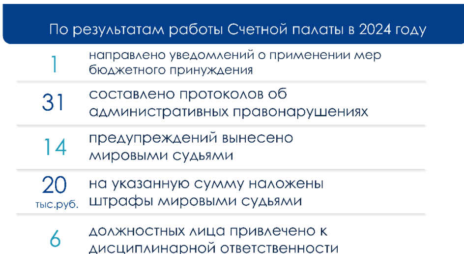
Рис. 3. Отдельные результаты деятельности Счетной палаты в 2024 году

К дисциплинарной ответственности привлечено 6 должностных лиц (вынесено замечание).