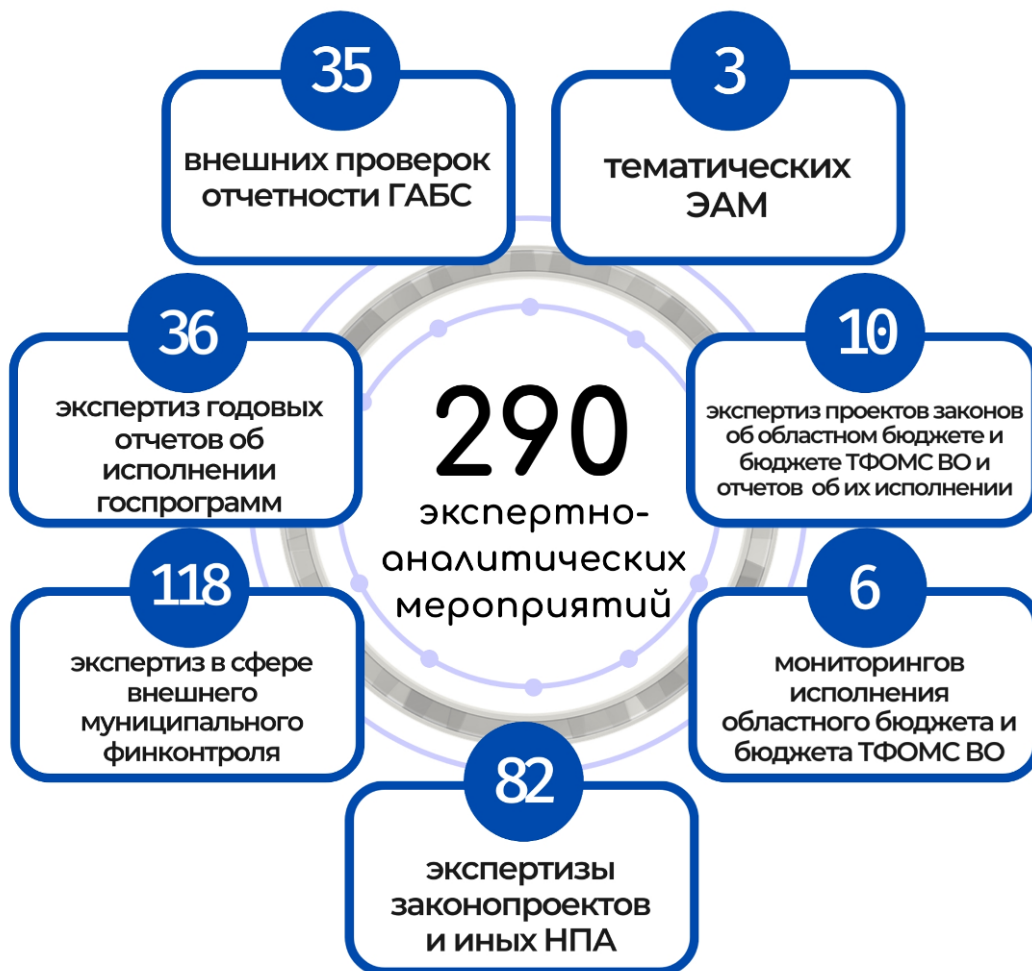
Рис. 7. Результаты экспертно-аналитической деятельности Счетной палаты в 2024 году

В 2024 году проведено 290 экспертно-аналитических мероприятий (рис. 7).