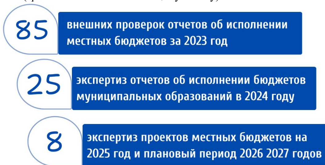
Рис. 10. Результаты реализации Счетной палатой полномочий по внешнему муниципальному финансовому контролю в 2024 году

В 2024 году в рамках переданных полномочий Счетной палатой проведено 118 мероприятий ( приложение № 6 к настоящему отчету ).