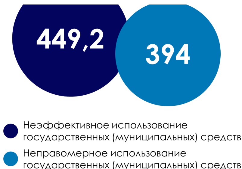
Рис. 4. Общие показатели неправомерного и неэффективного использования государственных (муниципальных) средств, установленных в 2023 году, млн. руб.

Наибольший удельный вес (50,7% от общего количества нарушений) приходится на нарушения при формировании и исполнении бюджетов . Всего установлено 1857 нарушений на общую сумму 126,6 млн руб. Значительная часть из них приходится на нарушения порядка принятия решений о предоставлении субсидий бюджетным или автономным учреждениям на выполнение государственного (муниципального) задания, порядка предоставления бюджетных инвестиций в форме капитальных вложений в объекты капитального строительства, осуществление капитальных вложений в объекты капитального строительства, порядка составления проекта бюджета и планирования бюджетных ассигнований, порядка реализации государственных (муниципальных) программ.