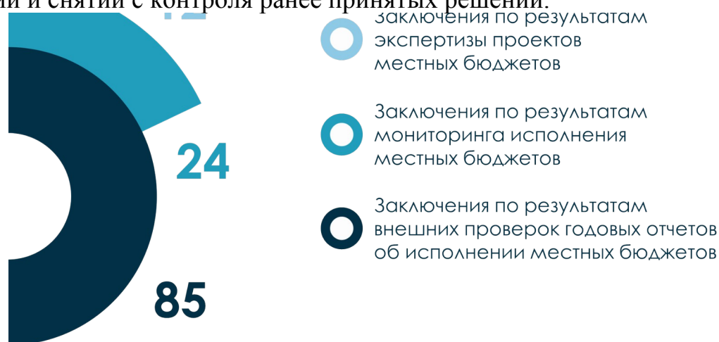
Рис. 3. Количество проведенных экспертиз в рамках переданных полномочий в сфере внешнего муниципального финансового контроля в 2023 году, ед.

нормативные правовые акты, 38 заключений по результатам экспертизы годовых отчетов о реализации государственных программ, 121 заключение по результатам мероприятий, проведенных в рамках переданных полномочий в сфере внешнего муниципального финансового контроля, включая 85 заключений по результатам внешних проверок годовых отчетов об исполнении местных бюджетов за 2022 год, 24 заключения по результатам мониторинга исполнения местных бюджетов в 2023 году и 12 заключений по результатам экспертизы проектов местных бюджетов на 2024 год и плановый период. Кроме этого, рассмотрено 149 вопросов о ходе реализации и снятии с контроля ранее принятых решений.