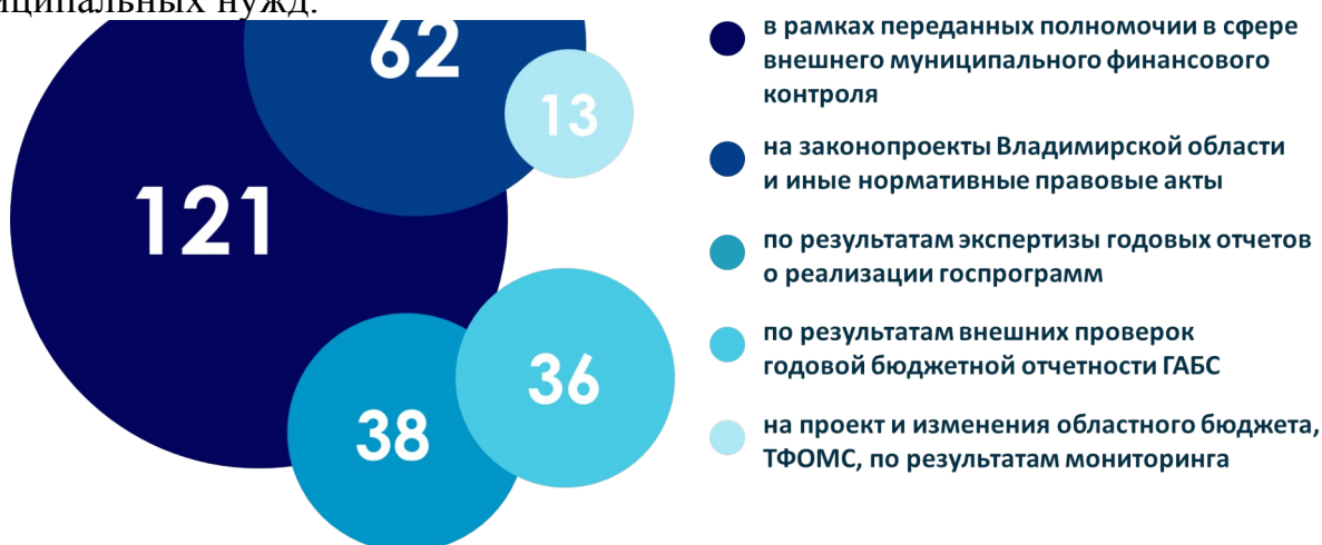
Рис. 2. Количество проведенных экспертиз в 2023 году, ед.

– обоснованностью и законностью закупок для государственных и муниципальных нужд.