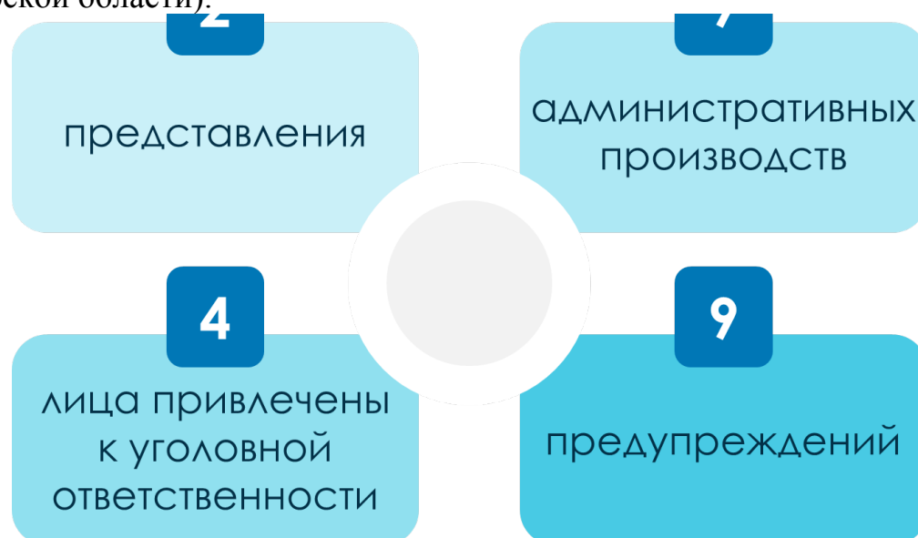
Рис. 6. Принятые меры правоохранительными органами в 2023 году.

По результатам проведенных мероприятий в прокуратуру, правоохранительные и надзорные органы направлено 23 информационных письма, в том числе: 16 – в прокуратуру Владимирской области, 2 – в Управление Министерства внутренних дел Российской Федерации по Владимирской области (далее – УМВД России по Владимирской области), 5 – в Управление федеральной антимонопольной службы по Владимирской области (далее – УФАС по Владимирской области).